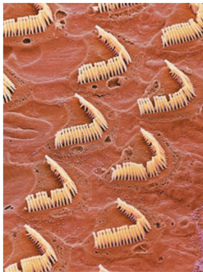
(a) དཔེ་རིས་ ༡ ་ ་ རྩི་བར་བྱི་ན། བར་ན། ལང་ན་བཅས་ཆ་ཤས་གསུམ་ཡོད། c. བར་རིས་འདྲིས་ཁོར་ཤི་དབང་པོའི་ནང་གི་ "བ་སྤྱ།" ལྷོན།

སྤྱ་ཡི་འབྲུང་ཁུངས་འཚོལ་བར་སྐྱོད་པས་ན་བ་གཉིས་ཀྱི་ནང་སྤྲི་བརྗོད་བཞུགས་སྐབས་དུས་ཚོད་ཀྱི་ཁྱུང་པར་ཅད་གཅོད་བྱེད་ཀྱི་ཡོད། བར་གཅིག་ ལ་ན་བར་འགྲོར་བར་གཞན་ལས་རྒྱང་ཐག་རིང་བ་འགྲུལ་བསྐྱོད་བྱ་དགོས་སྲིད། གལ་ཏེ་བར་གཉིས་པོར་འགྲུལ་བསྐྱོད་བྱེད་པའི་རྒྱང་ཚང་ གཅིག་མཚུངས་ཡིན་ཆོ། ། རྩིད་གྱི་ཁྱུང་པར་སྐྱོད་གོར་ཡིན་ན་། རྩིད་གྱི་སྤྲིའི་འབྲུང་ཁུངས་ཀྱི་སྤོགས་སུ་བཟུ་བཞིན་ཡོད།